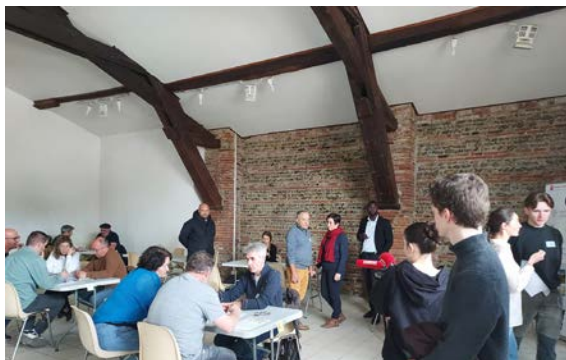
Des rencontres de 15mn en mode speed meeting pour se rencontrer et échanger sur un futur projet.