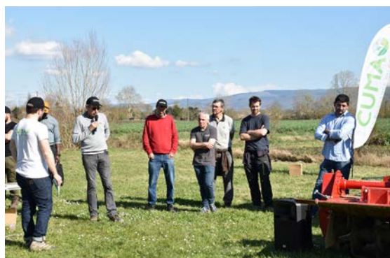
Démonstration de matériel animée par le FDCUMA.