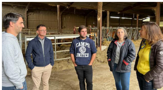
Visite au GAEC de Chayroux à Escoulis en présence de Carole Delga, le 1er novembre

Pour en savoir plus sur le dispositif REAGIR MHE, rendez-vous sur le site de la Chambre d'agriculture www.hautegaronne.chambre-agriculture.fr ou bien par téléphone au 05 61 94 81 60.