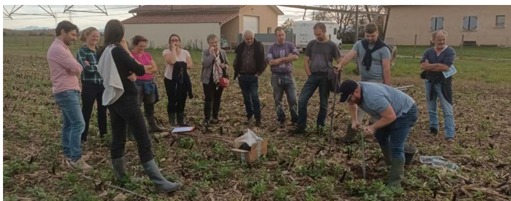
Réunion à Lavernose-Lacasse sur l'exploitation les Canongesses

La Chambre d'agriculture est impliquée sur un projet de territoire sur la gestion de l'eau intitulé Garon'Amont. Suite aux premiers diagnostics réalisés chez des agriculteurs irrigants, certains ont exprimés leur intérêt pour la réalisation de profil de sol. Des réunions bout de champs sur cette thématique sont organisées depuis le mois de novembre.