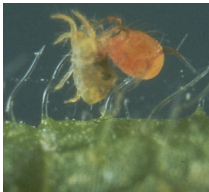
Phytoseiulus persimilis s'attaquant à un tétranyque tisserand.

Puisque sa vitesse de développement en conditions optimales est environ deux fois plus rapide que celle du tétranyque, sa population augmente rapidement, ce qui lui permet de réduire très vite les foyers d'acariens phytophages.