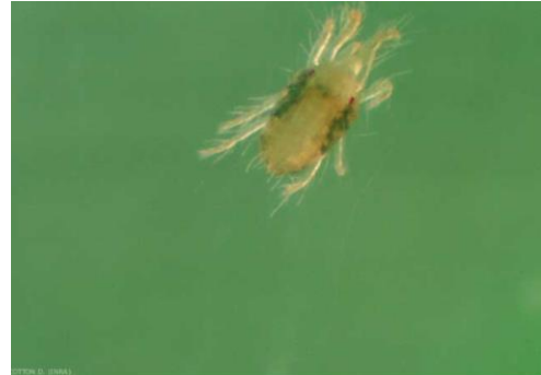
Femelle de Tetranychus urticae de forme jaune. Tétranyque tisserand (glasshouse spider mite)