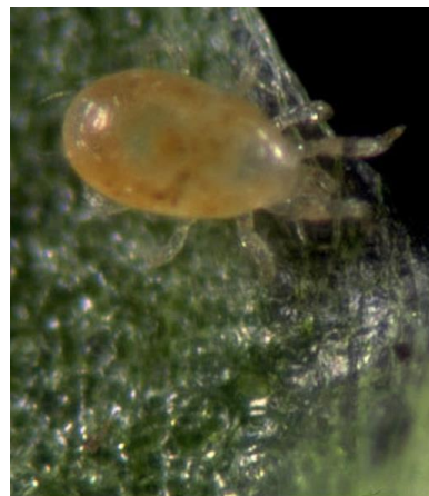
Adulte d' Amblyseius californicus .

Conditions optimales d'utilisation : températures élevées. 25-33°C (min 10°C) HR>60-70 %