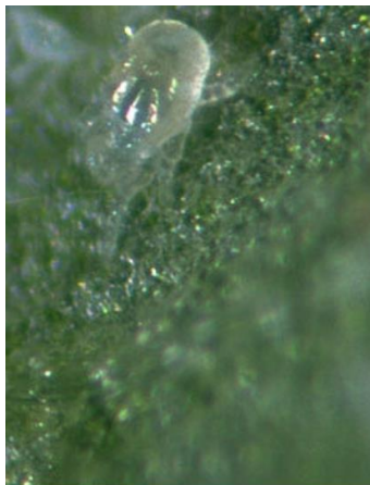
Larve d' Amblyseius californicus .

. Amblyseius californicus (aussi appelé Neoseiulus californicus ) – Acarien prédateur (Famille des Phytoséidés) - Acarien blanc aux téguments transparents avec un dessin orangé en forme de X