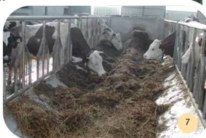
Vue du "cornacub®".