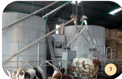
Cellules de stockage et le DAC.