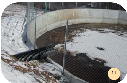
Vue de la fosse à lisier.