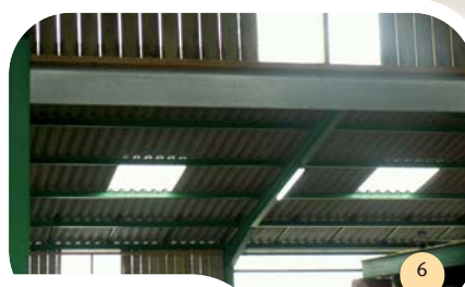
Bardage bois et polycarbonate.