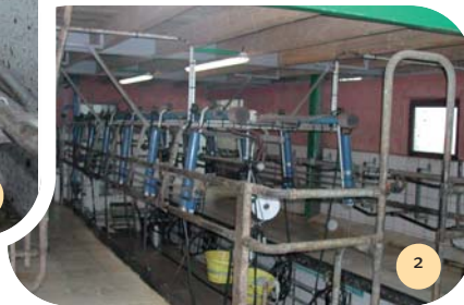
Salle de traite.