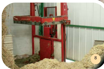
Désileuse à cubes.