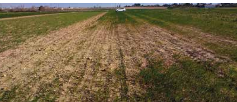
Piétin échaudage sur blé dur

L'objectif économique de l'expérimentation est évalué en global sur la durée de l'essai. La stratégie poursuivie prend en compte la rentabilité des cultures intermédiaires au blé : pois chiche ou fourrage.